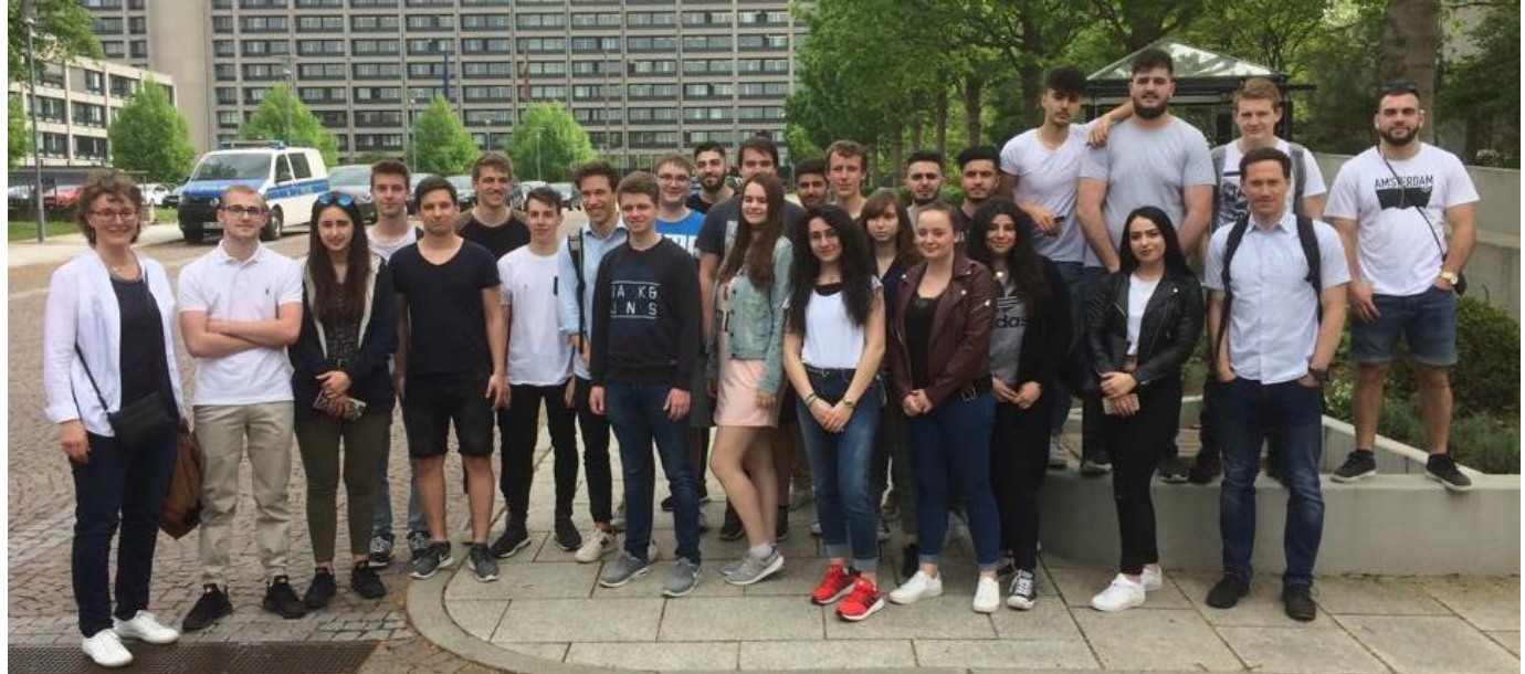
Exkursion in die Finanzmetropole Frankfurt am Main

Anlageformen Kreditfinanzierung Investitions- rechnung